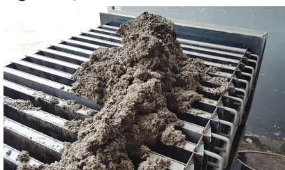
Fot. 2. Układanie i zagęszczanie mieszanki styrobetonowej w formie bateryjnej

Właściwości styrobetonu, tym bardziej z wypełnieniem w postaci odpadu styropianowego (EPS), powinny być określone na podstawie badań. Opracowanie nowego typu materiału polega na takim doborze ilościowym i jakościowym składników, który zapewni ukształtowanie kompozytu o z góry założonych właściwościach (wytrzymałość, przewodność cieplna, nasiąkliwość itp.). Nie da się tego zrobić bez udziału osób dysponujących odpowiednią wiedzą i doświadczeniem oraz odpowiedniej bazy laboratoryjnej. Punktem wyjścia podczas prowadzonych w zakładzie produkcyjnym firmy EKOBUD prób technologicznych była ocena przydatności istniejącego wyposażenia i parku maszynowego do produkcji elementów składowych nowego systemu. Konieczny okazał się zakup formy bateryjnej do produkcji płyt styrobetonowych (fotografia 2).